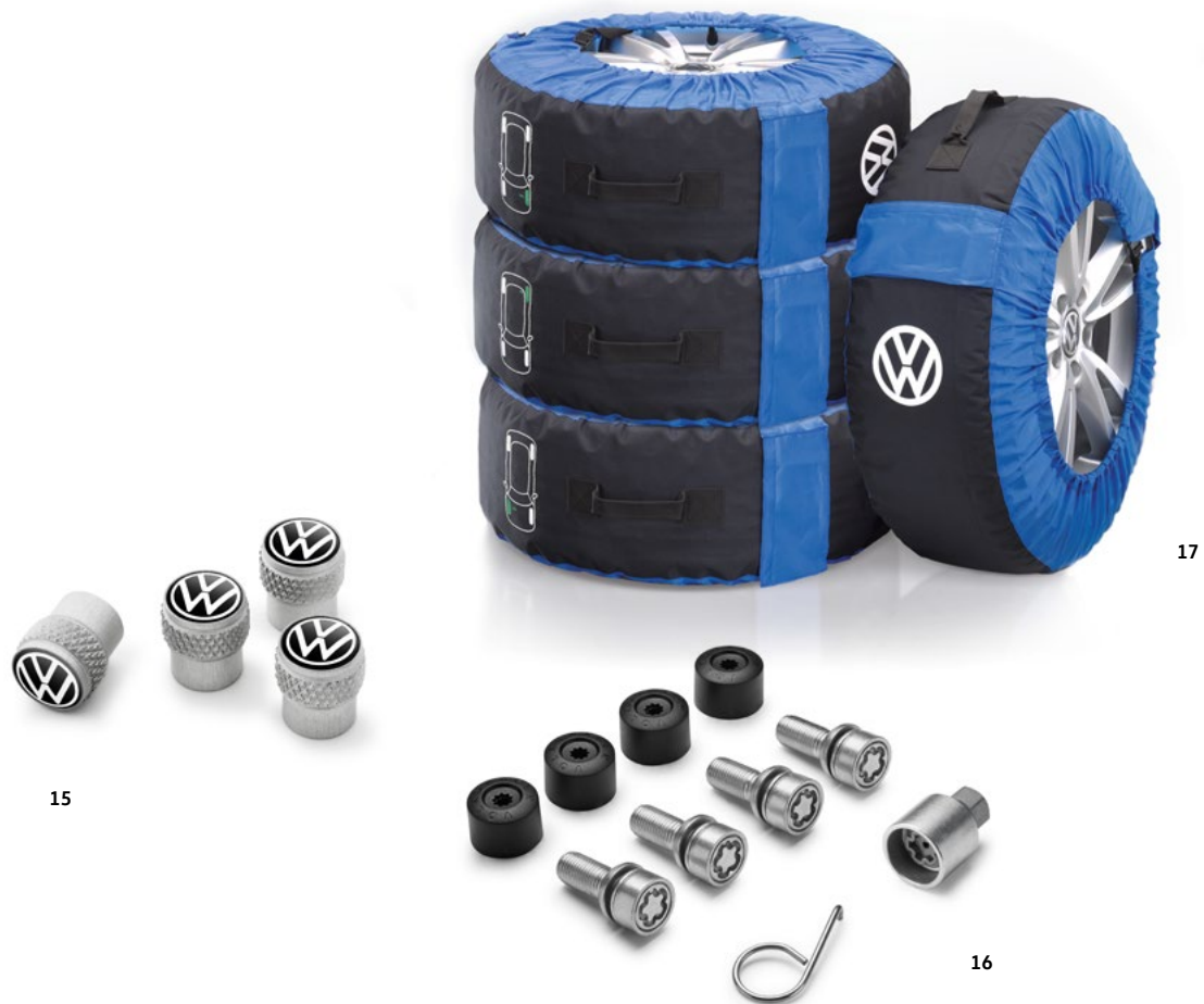
15 Padangų vožtuvų dangteliai